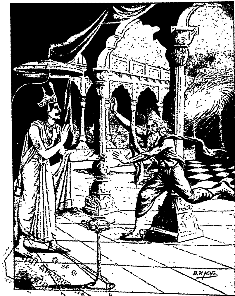
दुर्वासाजी अम्बरीषकी शरण आये